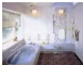
浴槽・洗濯での使用