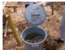
生ゴミ処理での利用